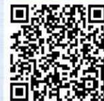
（群馬県デジタル窓口）