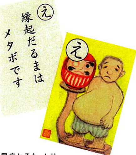
ぐんま糖尿病かるた より